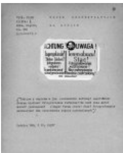
Ein Schild mit einer Aufschrift in deutscher und polnischer Sprache mit dem Hinweis auf ein Fotografieverbot unter Androhung der Erschießung. Schilder mit diesem Inhalt wurden an den Zäunen der Konzentrationslager angebracht. Ein Schild mit einer Aufschrift in deutscher und polnischer Sprache mit dem Hinweis auf ein Fotografieverbot unter Androhung der Erschießung. Schilder mit diesem Inhalt wurden an den Zäunen der Konzentrationslager angebracht. Den Deutschen war daran gelegen, dass Informationen über die Konzentrationslager nicht an die Öffentlichkeit gelangen.