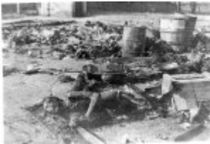
Übergangslager Żabikowo b. Poznan - Körper der von den Deutschen erschossenen und verbrannten Gefangenen während der Evakuierung des Lagers; Januar 1945, nach der Befreiung des Lagers. (AIPN)