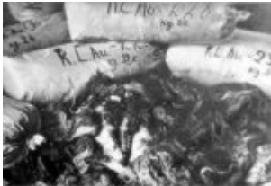
Ein Haufen von Säcken mit Haaren von in KL Auschwitz-Birkenau ermordeten Frauen. Die Haare wurden von den Deutschen verpackt und für den Versand zum industriellen Einsatz vorbereitet; 1945, nach der Befreiung des Lagers. (AIPN)