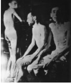
KL Buchenwald - niewolnicy III Rzeszy - wygłodzeni więźniowie; kwiecień 1945 r. po wyzwoleniu obozu.