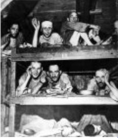
KL Buchenwald - Häftlinge im Lager auf Stockbetten; April 1945, nach der Befreiung des Lagers. (AIPN)