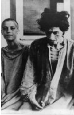
KL Ravensbrück Gefangene; 1945, nach der Befreiung des Lagers.