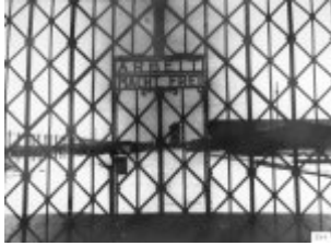
Tor zum KL Dachau mit der Aufschrift „Arbeit macht frei“.