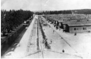
KL Dachau - Gesamtblick auf die Baracken, wo die Gefangenen lebten. Stacheldrahtzaun, durch den elektrischer Strom unter hohen Spannung floss, neben der Baracken stehen Gefangene; April 1945