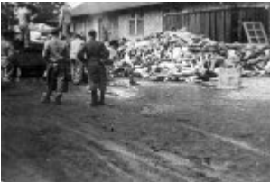
KL Dachau - Gefangene tragen die Körper der Ermordeten von der Plattform, im Hintergrund das Krematorium; 1945