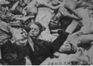
KL Dachau - Leichen der ermordeten Häftlinge; April 1945, nach der Befreiung des Lagers.