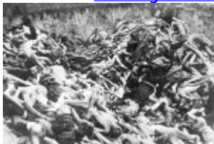
KL Bergen-Belsen - ein Massengrab ermordeter Häftlinge; April 1945 nach der Befreiung des Lagers.